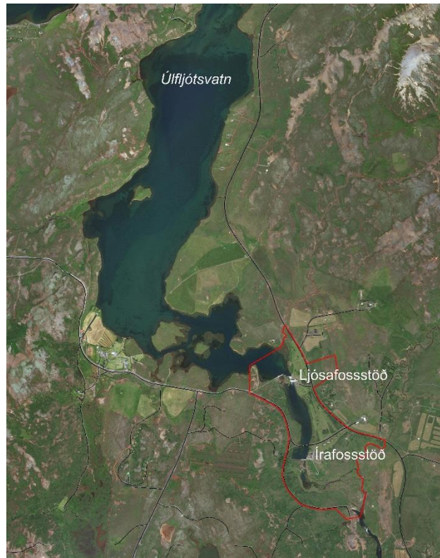
MYND 1. Skipulagssvæðið er sýnt með rauðri línu.

Með skipulagslýsingu þessari er íbúum og öðrum hagsmunaaðilum gefinn kostur á að koma með ábendingar og athugasemdir sem snúa að málefnum deiliskipulagsins og komandi skipulagsvinnu.