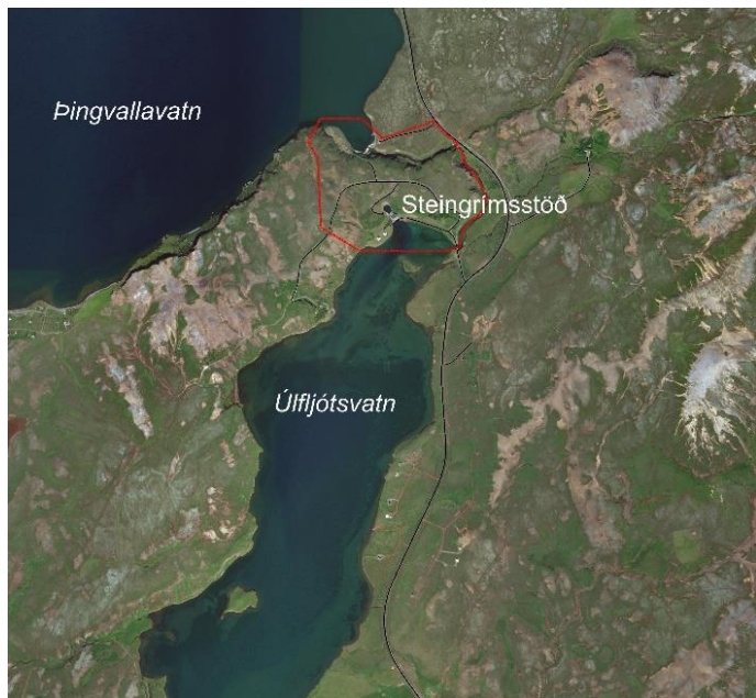
MYND 1. Skipulagssvæðið er sýnt með rauðri línu.

Deiliskipulagið er unnið fyrir framkvæmdaraðila sem er Landsvirkjun, með heimild sveitarstjórnar, í samræmi við 38. gr. skipulagslaga. Ráðgjafar við skipulagsvinnuna eru EFLA verkfræðistofa. Deiliskipulagið snýst í meginráttum um að staðfesta núverandi landnotkun.