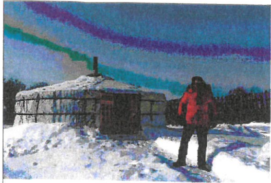
Yurt, asísk tjald (hirðingjatjald)