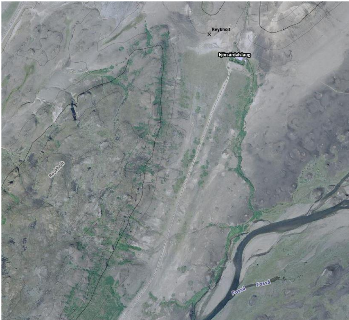
MYND 1. Myndin sýnir Reykholt í Þjórsárdal og nágrenni þess. (Loftmyndir ehf. 2017).

Tillaga að breyttu skipulagi snýr að uppbyggingu ferðapjónustu í Reykholti í Þjórsárdal. Fyrirhugað er að fjarlægja eldri mannvirki sem eru á svæðinu og byggja upp baðstað ásamt búningaðstöðu, veitingastað og hóteli fyrir allt að 45 herbergi. Mannvirki skulu felld að landi eins og kostur er.