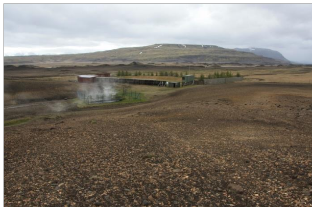
Mynd 3. Reykholt í Þjórsárdal.

Árið 2008 voru friðlýstar fornleifar í Þjórsárdal skráðar. Í Reykholti eru 7 friðlýstar fornleifar og eru þær í hlíð norðan við sundlaugina en tvær þeirra eru á túninu vestan hennar. Minjar eru innan skipulagssvæðis en engar framkvæmdir verða nær þeim en 100 m.